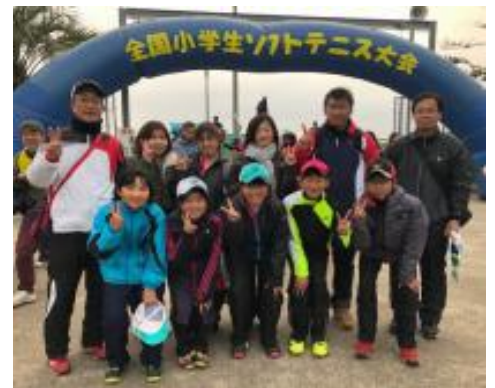
会場入り口で記念撮影