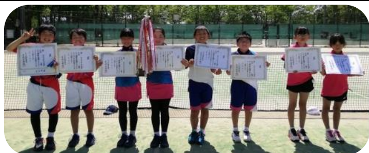
↑各部入賞した龍野ジュニアの選手たち ←保護者も参加！開会式