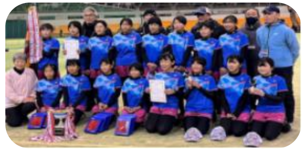
兵庫県女子Aチーム 優勝。 Bチーム 4位入賞