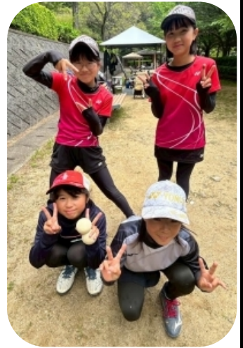
試合がんばるぞお～！