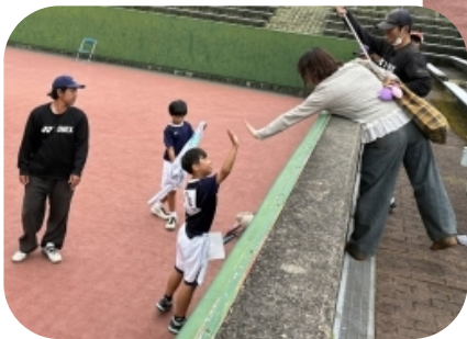
優勝の祝福を受ける選手

この大会は予選リーグ決勝トーナメント方式で実施され、男子は96ペア女子は102ペア参加しました。