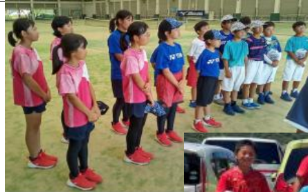
↑強化練習試合に参加した兵庫県選手団