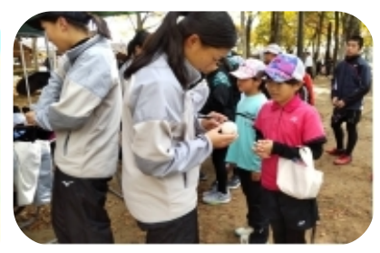
終わってからサイン会