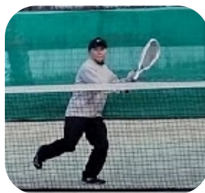
東芝の選手のお手本