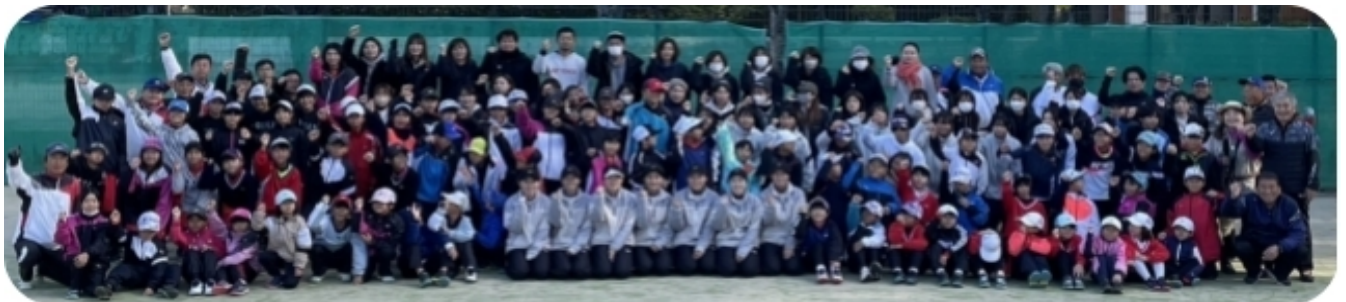
参加者全員で記念撮影(東芝姫路の選手たちは前列中央 監督は前列右端)

今年は途中、雨が降るアクシデントがありました。雨が振ってる最中も東芝姫路の選手たちの指導は続きました。今回はサンテレビの「いいねテニス」の取材もあり、サンテレビでの放送はもちろんですが、TVerでも放送されます。